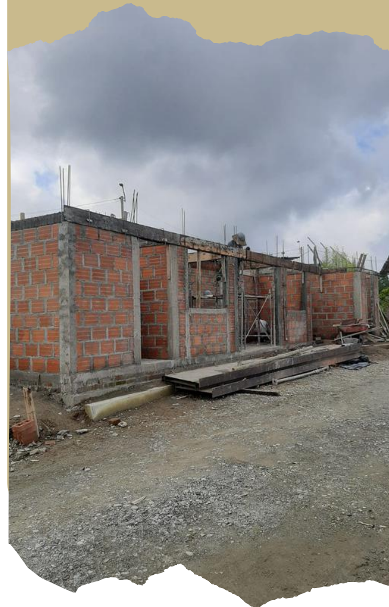
Unidad temporal de residuos