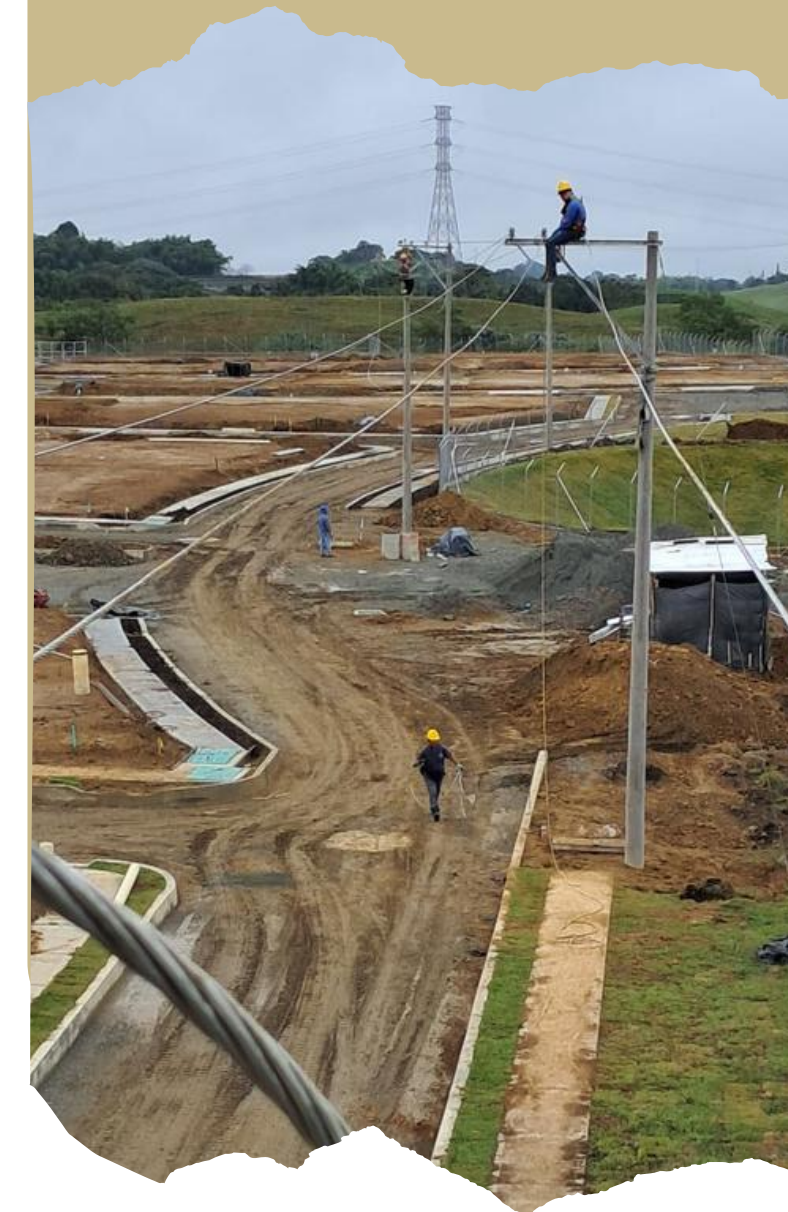
Red de media tensión