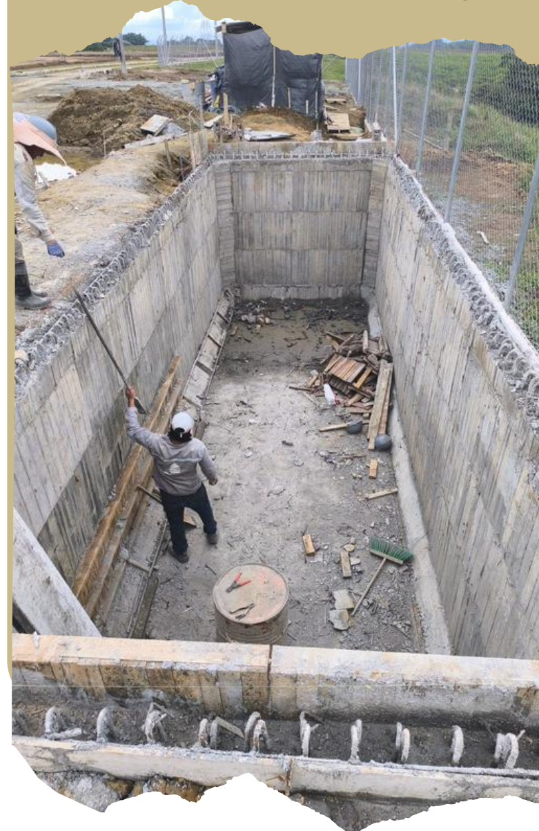
Tanque de almacenamiento de agua